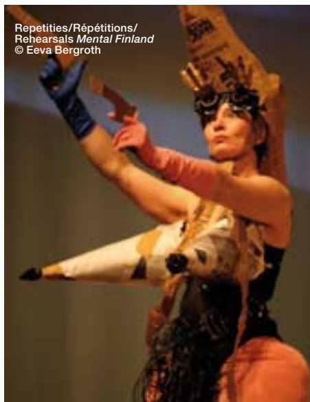
Repetitions/Répétitions/ Rehearsals Mental Finland

Suite FR > Et dans la même veine, il considère qu'être artiste est une vocation. «Être artiste est de plus en plus considéré comme une profession «normale», pour moi c'est une profession parfaitement «anormale». Ni meilleure, ni plus mauvaise que d'autres, mais bien totalement différente. Depuis que l'humanité existe, l'artiste a toujours été «l'autre» dans la communauté, pas seulement un individu occupant une position différente: il révèle l'existence d'autres univers possibles. L'artiste est quelqu'un qui exerce une opposition mais qui fait aussi rêver les gens. L'art n'a donc rien à voir avec l'épanouissement individuel, avec un certain lifestyle ou quality time .» Et Smeds de s'expliquer: «Prenez l'albinos dans le règne animal. Normalement, les animaux tuent leurs congénères atteints d'un handicap ou d'une malformation. Mais les albinos ne sont jamais tués parce que le blanc est la couleur de la mort. Donc, les albinos sont radicalement différents, mais ils sont respectés. C'est un peu la même chose pour l'artiste. Être artiste n'est pas un concept individuel mais collectif. Un artiste ne travaille par pour lui-même mais pour les autres.»