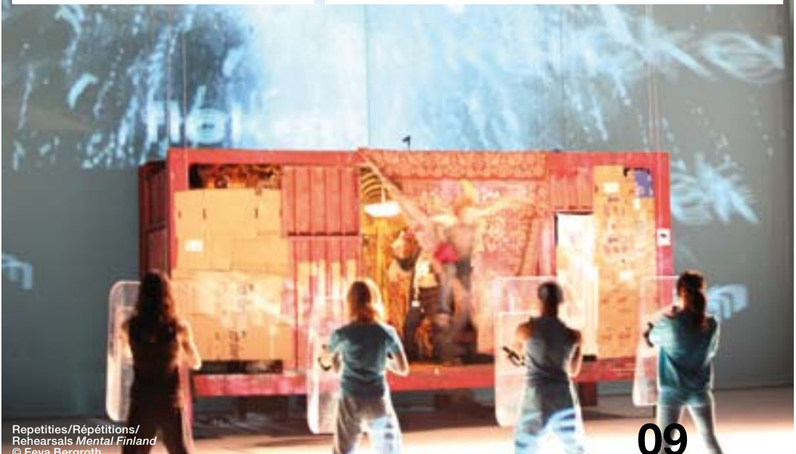
Repetitions/Répétitions/ Rehearsals Mental Finland

Les citations de ce texte sont extraites d'une interview avec Kristian Smeds, réalisée par Ivo Kuyli. La version intégrale en néerlandais est publiée dans le n° 115 d'Etcetera, magazine pour les arts de la scène.